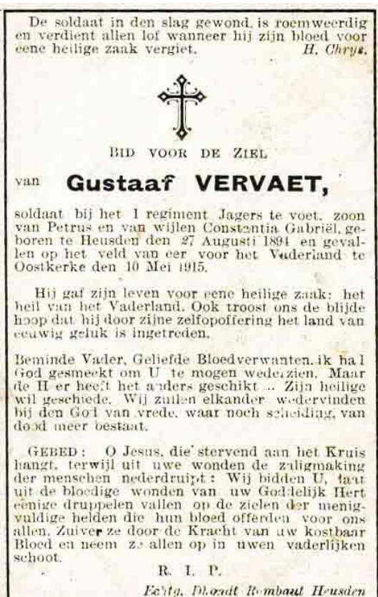
Bidprentje van Gustaaf (13)