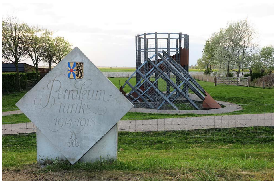
Gedenkplaat aan en evocatie van de 'Petroleumtanks' langs de IJzerdijk

Detail uit de Fiche Dienst Oorlogsgraven: op twee dagen tijd twee verschillende versies (11)