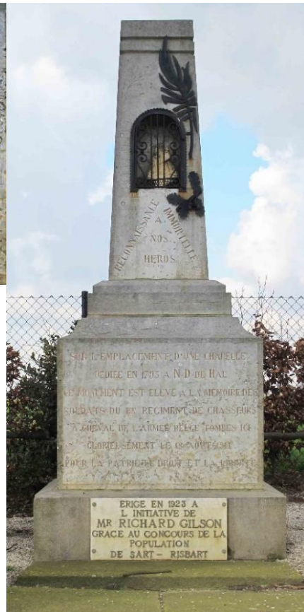
Monument in Sart-Risbart om de gesneuvelde soldaten van het 1ste Regiment Jagers te Paard te gedenken (foto's Luc Donners, 2014)