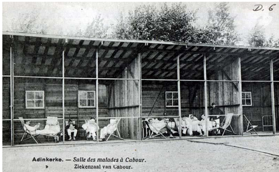
Ziekenzaal in Cabour (nabij Adinkerke) (6)

Op 1 april 1918 werd hij opgenomen in de ziekenboeg van het opleidingscentrum te Eu. Midden juni 1918 was Germain in het Militair Hospitaal te Montpellier waar hij begin juli werd ontslagen en van waaruit hij naar het Militair Hospitaal van Cabour (nabij Adinkerke) werd overgebracht. Op 26 juli 1918 verlaat hij ziek het C.I.S.L.A.A. waar hij op 31 januari 1919 weer aanwezig was. (4)