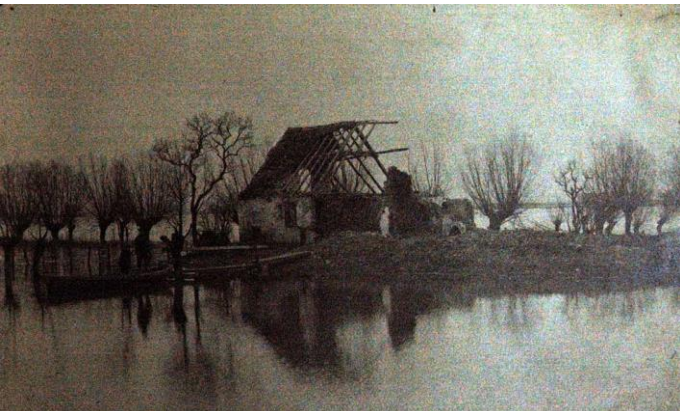
Sector Nieuwkapelle onder water (6)

Op 17 mei 1915 vervoegde hij als 'soldaat tweede klasse' (met stamnummer 133/1207) het 1ste Regiment Karabiniers (4). Van 1 juli tot 5 augustus 1915 kreeg het 1ste Karabiniers rust in Bray-Dunes. De volgende maanden (van 6 augustus tot 6 december) lag het regiment in de sector Diksmuide. De soldaten lagen in het centrale deel van de sector: tussen de wegbrug en de spoorwegbrug. De soldaten zaten in een routine; om de vier dagen wisselden 'dienst in de tranché', rust, piket en rust mekaar af. Dagelijkse beschietingen en de zware uit te voeren werken demoraliseerden de manschappen. De jaarwisseling brachten de karabiniers niet door in de eerste linies: vanaf 7 december 1915 tot 20 januari 1916 kregen ze rust. Ze kantonneerden op verschillende plaatsen. Maar de voortdurende regen maakte het weinig aangenaam. De volgende maanden (tot 22 december) hield het 1ste Karabiniers de wacht in de sector Nieuwkapelle. De regio was onder water gezet: de vijand lag ver weg. Het was een eerder rustige sector zodat de verliezen in die periode beperkt bleven. Bij het jaareinde werd de soldaten weer rust gegund: de karabiniers kregen rust in Leisele (en omgeving). Vlak na Kerstmis werden de regimenten karabiniers gereorganiseerd (5).