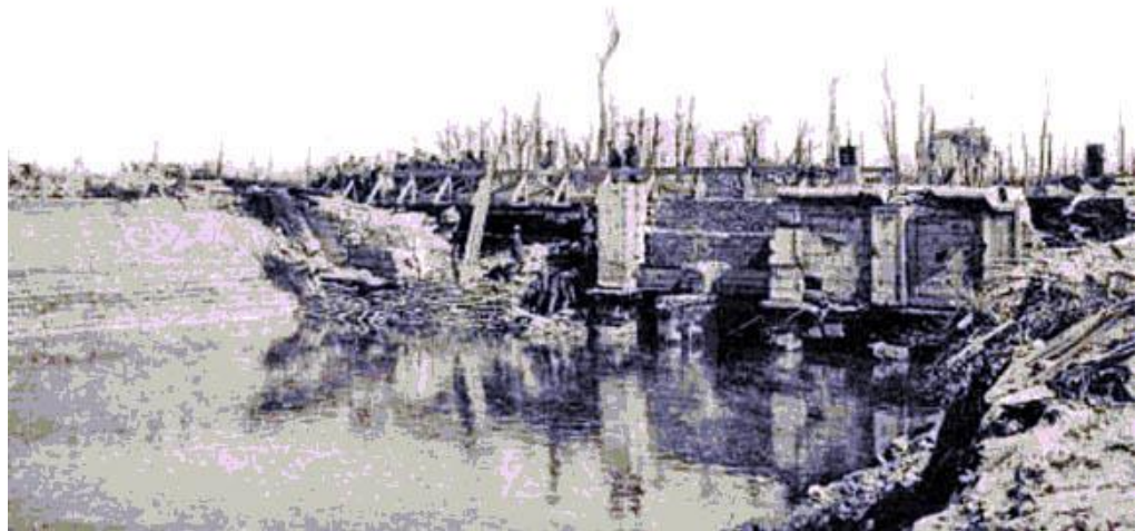
De sluizen die de overstroming regelden (6)

Vanaf half mei tot begin juli lagen de soldaten van het 3de Karabiniers in de eerder rustige loopgraven van Nieuwpoort-Bad. Ook hier gold de regel: artillerie beantwoord met artillerie (7). Op 21 mei werd René wegens ziekte weer opgenomen in de infirmerie (4). Tot 30 juli was het 3de Karabiniers dan weer in reserve. Vanaf 9 augustus waren René en zijn medesoldaten belast met de wacht in de sector Boezinge. In deze sector waren geen loopgraven; het was een volledig 'bloot' terrein waar de verdediging steunde op her en der verspreide weerstandspunten. Bij dag reageerde de vijand bij elke beweging onmiddellijk met een beschieting. Met uitzondering van de schildwachten verschool iedereen zich in de 'abris'. 's Nachts kwam iedereen uit de schuilplaatsen: mitrailleurs ratelden en de geweren losten salvo's terwijl de voorposten vaak bedolven werden onder een regen van granaten (7).