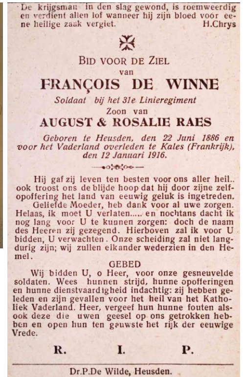
Grafsteen van François (links), een detail (midden) (foto's Luc Donners, 2014) en het bidprentje van François (9)

Op het bidprentje van François staat een foutieve sterfdatum vermeld. Hij zou in 1916 gestorven zijn. De daar vermelde eenheid (31ste Linierement) is de naam van het regiment dat bij oorlog ontstond door de ontduubeling van het 11de Linierement.