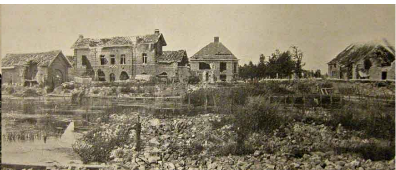
Pervijze na de Duitse beschietingen tijdens de Eerste Slag om de IJzer: ruïnes van de kerk (links) en het stationsgebouw (rechts) (6)

Van in het begin waren de leefomstandigheden van de soldaten in de loopgraven erbarmelijk. Op 4 januari 1915 werd François opgenomen in de I.M.D. (Infirmierie Médicale Divisionnaire) (7). Op 12 januari 1915 stierf François om 15.30 u. in het