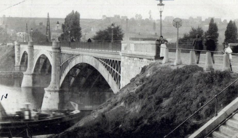
ANDENNE - Pont sur la Meuse, reliant Andenne et Seilles, détruit en 1914.