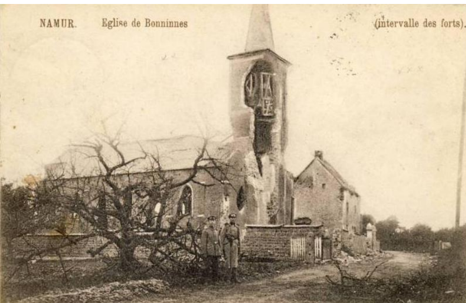
De kerk van Boninne: beschadigd door Duitse beschietingen (9)