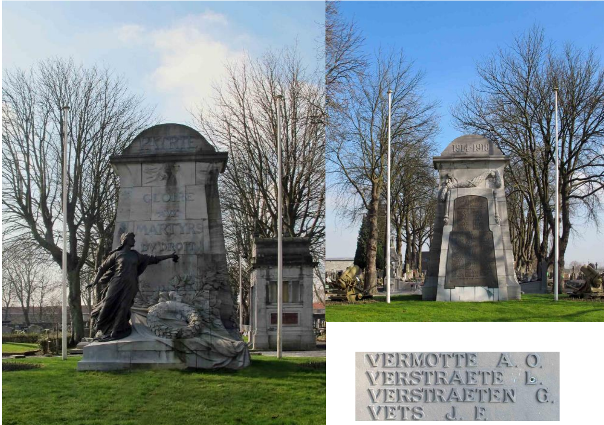
Monument op de gemeentelijke begraafplaats van Rhées (Herstal): links de voorkant, rechtsboven de achterkant en rechtsonder een detail (foto's Luc Donners, 2014)