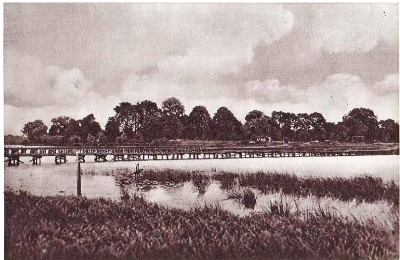
De opgeblazen Maasbrug ter hoogte van Visé hield de Duitse opmars even tegen (links) (8) en de door de Duitsers gebouwde brug in Lixhe een brug waar ze de Maas konden oversteken. (9)